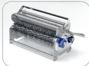
Gruppo lame inteneritrice con 96 lame Tenderizing blade assembly with 96 blades