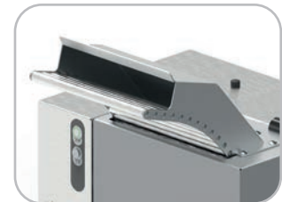
Scivolo con rulli opzionale Optional roller slide