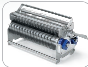
Gruppo lame taglio: da 10 mm con 48 lame da 15 mm con 32 lame Cutting blade assembly: 10 mm with 48 blades 15 mm with 32 blades